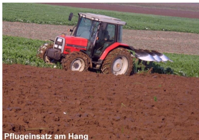
Pflugeinsatz am Hang

ACHTUNG: Neue Berechnung der Erosionsgefährdung seit 2017 - Bitte prüfen Sie Ihr Flurstücksverzeichnis!