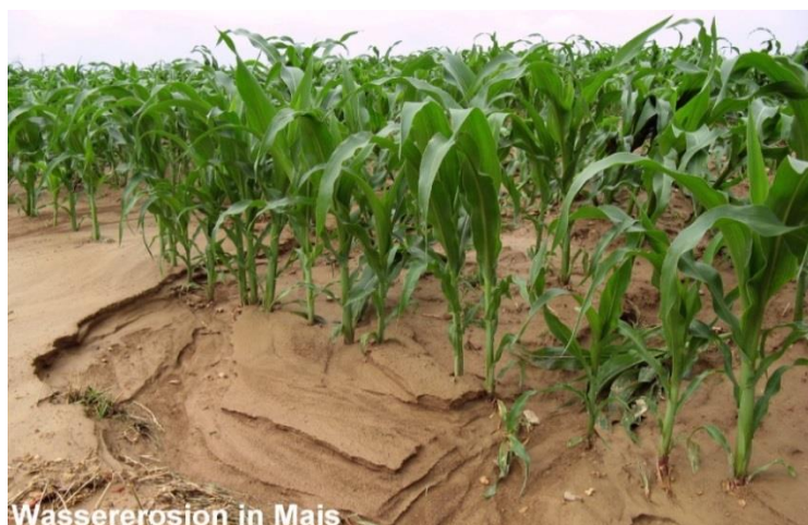
Wassererosion in Mais